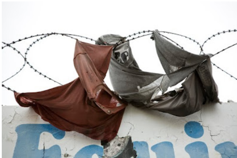
Recycling Clothing Art