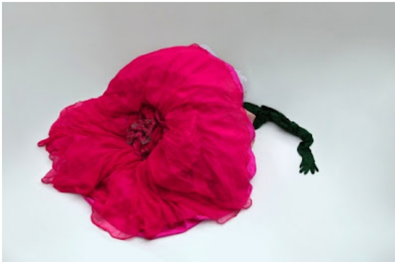
Red Carpet Keeper, 2009