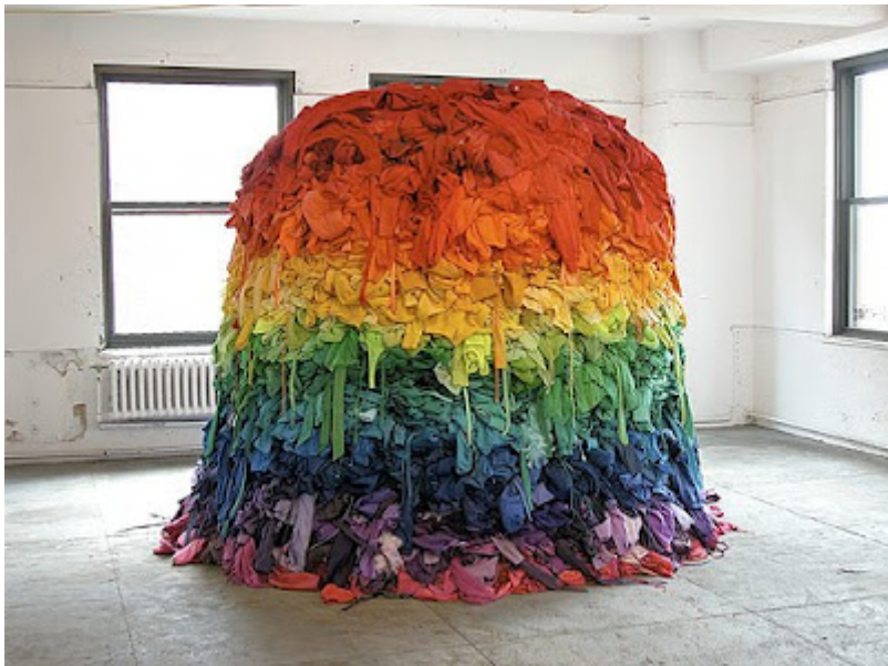
Sunt omnes unum, 2008