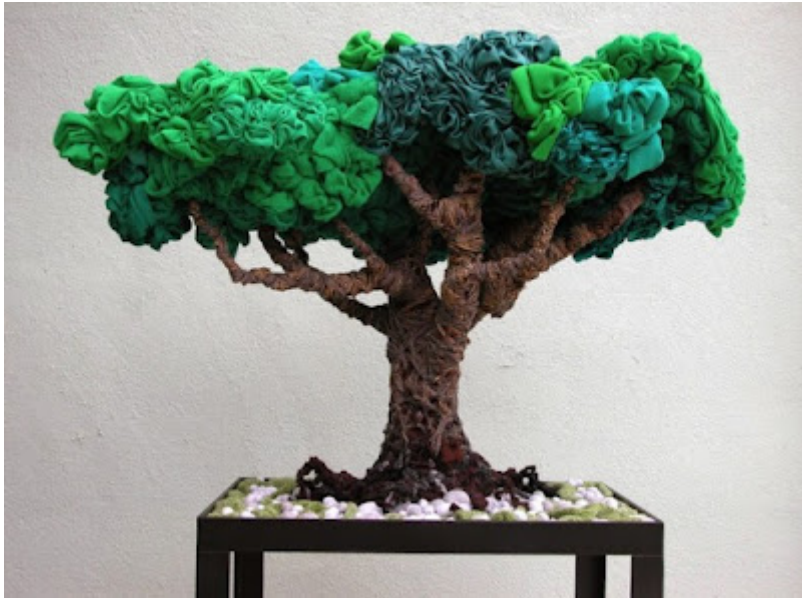
Magenta Flower, 2002